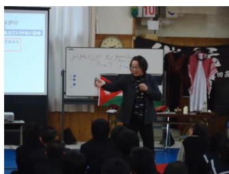
国際協力出前講座