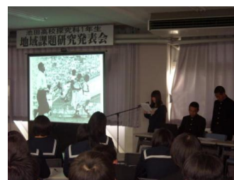
地域課題研究発表会