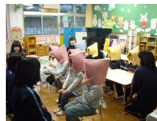
防災ずきんの贈呈

その際、防災ずきん用の布などを購入し、池田高校防災クラブの生徒たちが防災ずきんを縫って地域の幼稚園に寄贈した。他にも災害時用の折りたたみの担架やバケツなどを購入し、池田高校が災害時の緊急避難場所として活動できるよう準備に協力した。生徒たちは、地元の人々と協力することで、緊急災害時にも自分たちのできることがいろいろあることに気付き、いざというときに行動のできるように心の準備ができ、自己肯定感の育成もできたように思われる。