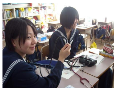
進路・キャリアガイダンス

年間を通じて、4回実施された進路・キャリアガイダンスや進路講演会は、自己の将来の夢や職業観を見つめなおす良い機会になったと思われる。参加した生徒は、「仕事の内容を具体的に知ることができて良かった。」と自己の将来について具体的に考えを膨らますことができたようであった。