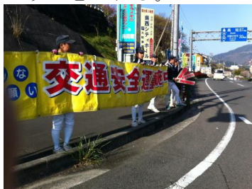
交通安全キャンペーン

夏休みなどには地域の公民館や幼稚園と連携してサイエンス教室や絵本の読み聞かせなどのボランティア活動にも積極的に参加した。ボランティア活動に参加することで様々な人と交流することができ、生徒自身の人間的な幅が広がったように思われる。また、これをきっかけとして将来の自分の進路の在り方についても考えることができたように思われる。