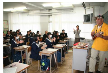
国際理解ガイダンス

1年生対象に行った11月の国際理解ガイダンスでは、トンガ、ボリビア、中国、ペルー、ポルトガルの出身者を招き、各国の民族衣装、踊り、音楽、楽器などを実物や写真を使って紹介してもらい、人との関わりの中で感動したことや困ったことなども話していただいた。生徒たちは事前に学習したことについて、クイズ形式にして紹介をしてくれたことに大変盛り上がりを見せ、活発な意見交換ができていた。そして、それぞれの国を身近に感じることができたようであった。