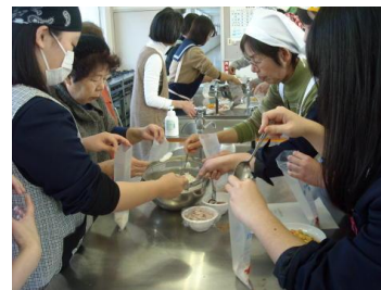
地域と連携した防災訓練

12月の環境美化活動では、校区内の駅や公園の清掃活動を実施した。清掃したところが美しくなることで自分の気持ちも清められたような気持ちになったようである。また、地域の方からは「きれいにしてくれてありがとう。」などの言葉をいただき、やってよかったと感じることができ、社会貢献の精神や郷土愛について考えることができたようであった。